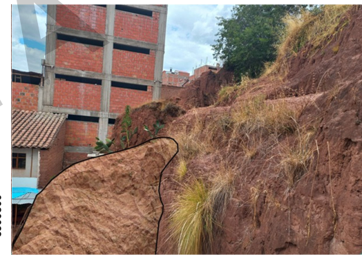
Taludes fuertemente empinados donde hay una evidencia de caída de suelos a causa de las precipitaciones pluviales