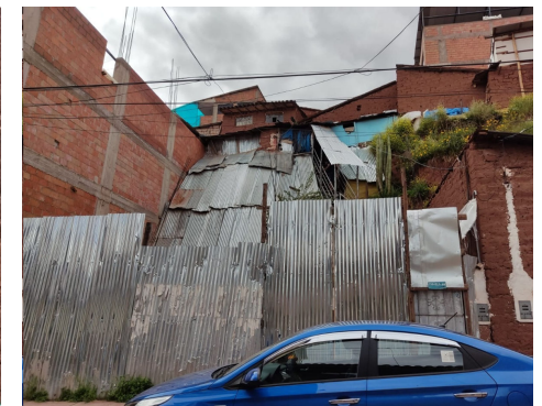
Taludes protegidos con calaminas para evitar el impacto de las lluvias