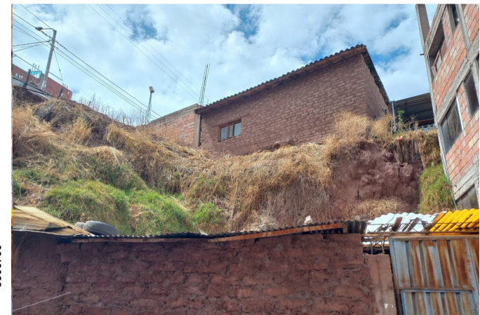
Viviendas encima de la corona del talud y viviendas cercanas al pie del talud, con una probabilidad muy alta a manifestarse las caídas de suelos